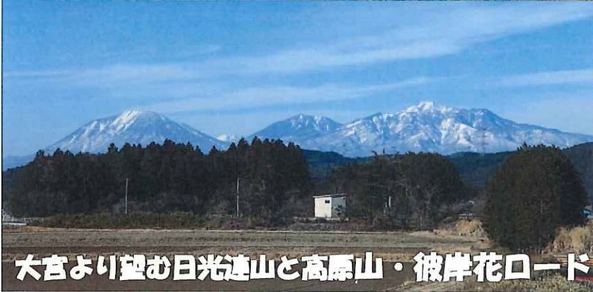
大宮より望む日光連山と高原山・彼岸花ロード