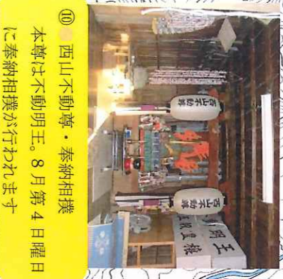
⑩ 西山不動尊・奉納相撲 本尊は不動明王。8月第4日曜日に奉納相撲が行われます