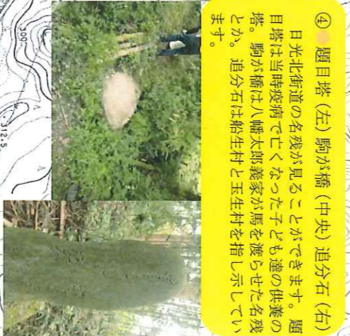
④ 題目塔(左) 駒が橋(中央) 追分石(右) 日光北街道の名残が見ることが出来ます。題目塔は当時疫病で亡くなった子ども達の供養の塔。駒が橋は八幡太郎義家が馬を渡らせた名残とか。追分石は船生村と玉生村を指し示しています。