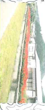
⑤ 芦場新田駅跡 東武矢板高徳線の駅ホーム跡地。線路跡は学道と呼ばれています。南側の山には日光欽山がありました。