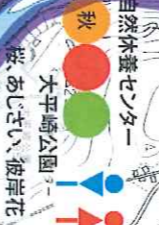
自然休養センター 大平崎公園 あじさい・彼岸花