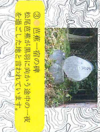
③ 芭蕉一宿の碑 松尾芭蕉が黒羽に向かう途中の一夜を過ごした地と言われています。