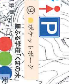
⑨ ●●● ポケットパーク 星ふる学校くまの木 天体観測