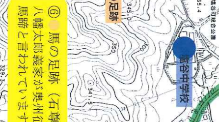
⑥ 馬の足跡(石尊山頂上付近) 八幡太郎義家が奥州征伐の折に残した馬蹄と言われています。