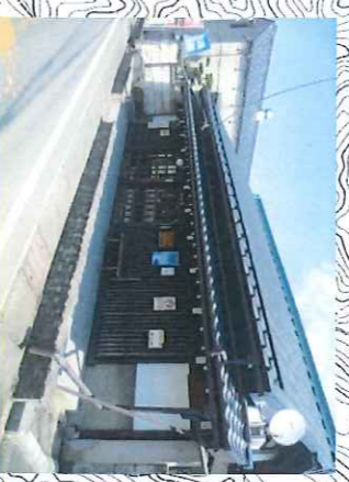
② ● 和気記念館(入館料大人 500円) 幽玄の美を描いた町出身の画家和気史郎の絵が展示されています