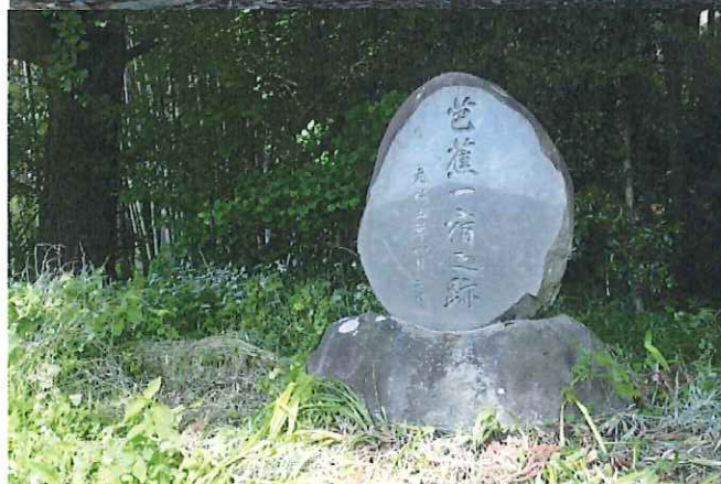
日光北街道と芭蕉一宿の跡