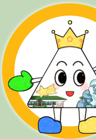
イメージキャラクター 選考・次点作品 あるくん