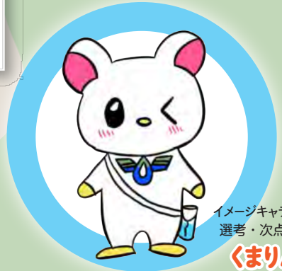
イメージキャラクター 選考・次点作品