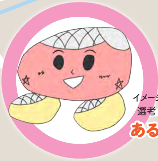
イメージキャラクター 選考・次点作品 あるこうくん