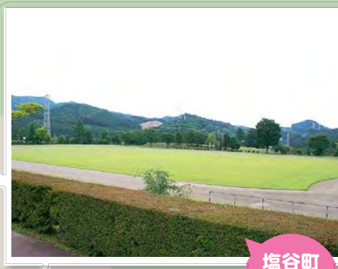
塩谷町 総合運動 公園