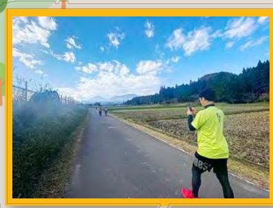
西岡剛選手の歩いた塩谷町

プロ野球、メジャーリーグで活躍された福岡北九州フェニックスの初代監督の西岡剛さんがここ塩谷町の「しおや湧水の里100kmウォークを歩かれた際の写真です。皆様はここがどこか分かりますか？