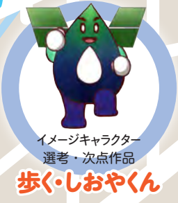
イメージキャラクター 選考・次点作品 歩く・しおやくん