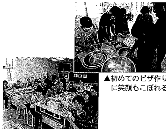
▲初めてのピザ作り に笑顔もこぼれる

船生にある日本語学校「とちのき学院」の留学生のみなさんが、生涯学習センターの調理室で、母国の郷土料理づくりと手作りピザにチャレンジしました。 東南アジア方面からの留学生が多いとちのき学院です。みなさん熱心に日本語と日本文化を日々学んでいます。ピザ作りや郷土料理づくりも、みなさん笑顔で楽しんでいました。色とりどりの料理が揃い、みなさんでの「いただきます」も満面の笑顔でした！初めてのピザ作りが、留学生の皆さんにとって素晴らしい経験になったようですね！ 「ピザ窯利用をご希望の方は、生涯学習課（四八・七五〇三）までお問い合わせ下さい」