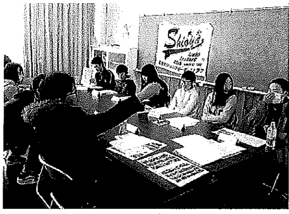
▲議論と笑顔が飛び交う定例会

今年度は中学一年生会員が大幅に増え、子ども会連合会の行事や町の行事等、あちこちで学ばせていただいているJLC（ジュニアリーダーズクラブ）のみなさんです。 定例会では、それぞれの会員がしっかりと自分の考えをもって臨み、様々なアイデアや考えが年齢関係なく元気に飛び交っており、とても活発です。学校では経験できないボランティア活動を通して、「まちづくり」の一端に関わっているという自覚と自信が会員のみなさんにも現れており、来年度もますます活躍と成長が楽しみなジュニアリーダー達です。 これからも、みなさんががんばってください！