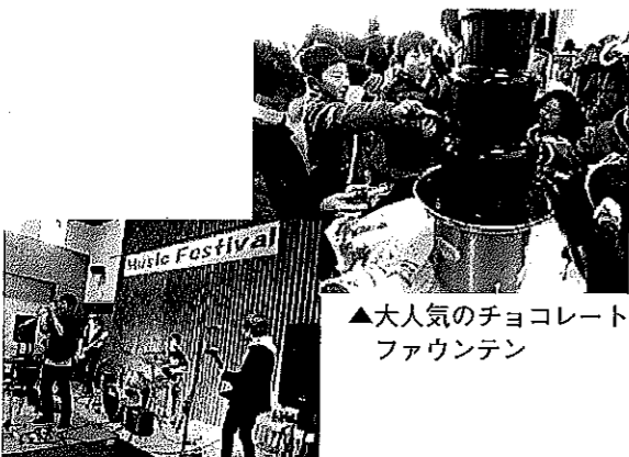
▲大人気のチョコレートファウンテン

第一回 あったか塩谷のトマト鍋 道の駅「湧水の郷しおや」オリジナル鍋、 二月七日、道の駅「湧水の郷しおや」にて「第一回あったか塩谷のトマト鍋」が開催されました。塩谷町特産品の「トマト」や野菜を使い、一日限定のオリジナルトマト鍋を大鍋でつくるイベントです。 干食のトマト鍋を用意しましたが、全て完食するほどの大盛況でした。トマト鍋を食べた方は「とてもおいしい。鶏肉もやわらかいしチーズが最高！」と好評でした。中には、自宅で作りたいのでレシピを教えて欲しいといわれる方もいました。レシピは、HPにアップしてありますので、ぜひご確認ください。 今回のトマト鍋は、飲食館内の「実のり食堂」に作って頂きました。「実のり食堂」では、地元産季節野菜を使用したランチや自慢の特製オリジナル焼きそば等を提供していますので、一度ご来店してみてください。