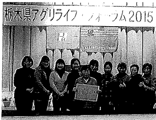
▲しおや生活研究グループ協議会のみなさん

打って食べて おいしかった！ 二月八日、船生地区コミュニティ推進協議会が「そば打ち体験」を道の駅「湧水の郷しおや」多目的ホールで開催しました。 親子含め十一組が地元そば打ちサークル「麺会スタツフ」の丁寧な指導のもと挑戦しました。細いも太いも自分で打ったそばの味は格別、その場で試食し「おいしい」と一言。 「今度いつやるの？」とのさいそくもあり、是非次回の開催をお願いいたします。