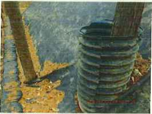
立木保護管 (コルゲート管)