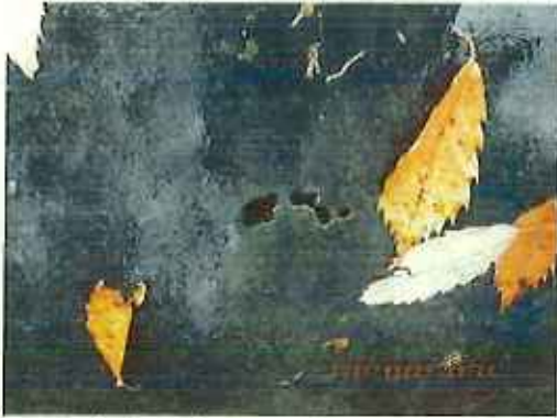
遮水シート (一部に穴)