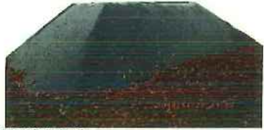
保管場所 (固い無し)