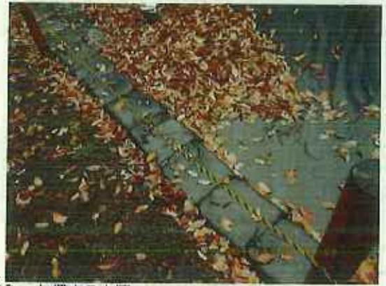
遮水シート押さえと囲い