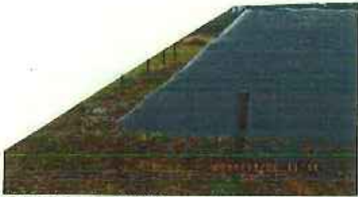
保管場所 (囲い 有刺鉄線)