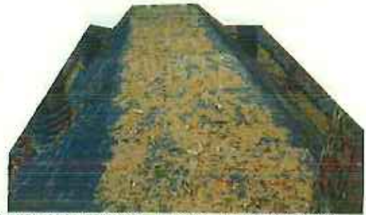
保管場所の中に立木が生えており、立木部分は遮水シート切除