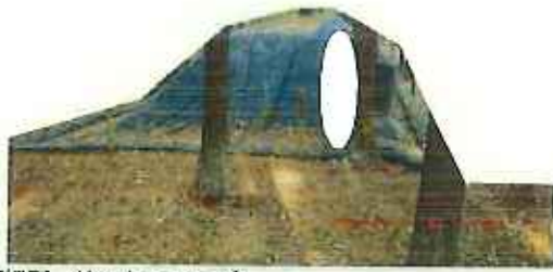
保管場所、杭&トラロープ