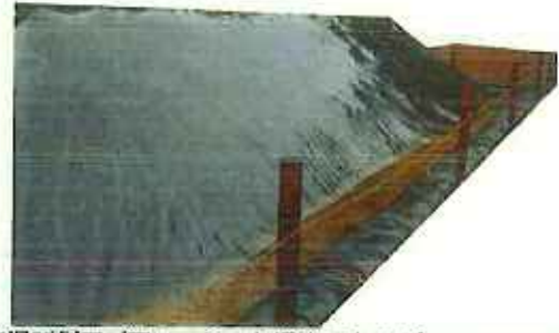
保管場所側面 (囲い、シート押さえ土のう)