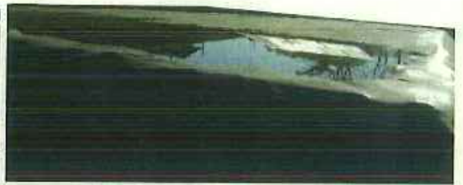
保管場所（上部）水たまりがある